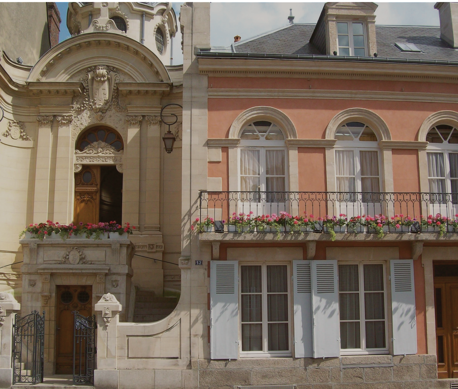
Casa natal em Alençon

Aprouve a Deus rodear-me de amor toda a minha vida. As minhas primeiras recordações estão marcadas pelos mais ternos sorrisos e carícias!... Também pôs muito amor dentro do meu coraçãozinho, criando-o amante e sensível.